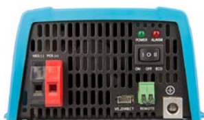
Phoenix 12/375 VE.Direct