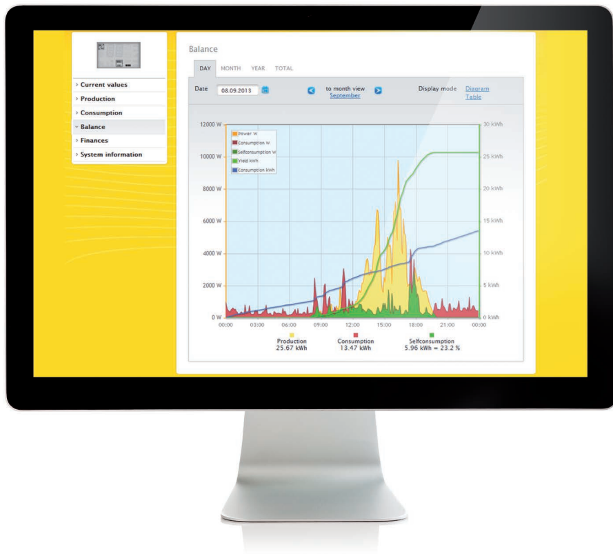
El rendimiento generado y el consume de la planta FV se muestran en la sección "Balance"

toconsumo en una gráfica. El contador eléctrico ya está integrado en los nuevos modelos Solar-Log 300 con contador y Solar-Log 1200 con contador y ofrece las mismas funciones que un contador externo.